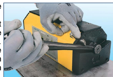
Désactivation nécessitant les 2 mains

Aimants Néodyme Fer Bore assurant une force concentrée et inaltérable. Dispositif de sécurité bloquant le levier et empêchant toute désactivation accidentelle de l'aimant. Conception sans soudure portante. Charge maintenue exclusivement par la force des aimants permanents sans alimentation électrique. Ne nécessitent qu'un entretien réduit.